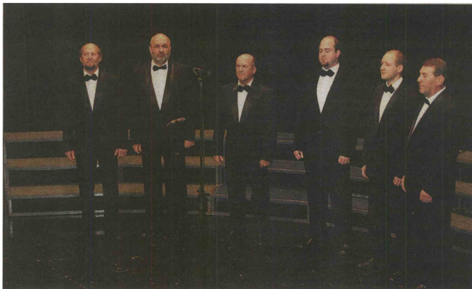
Našo regijo bo v Ljubljani zastopala vokalna skupina Fantje na vasi.

Koncerte organizira Javni sklad za kulturne dejavnosti (JSKD) , potekali pa bodo v šestih slovenskih mestih. Sočasno kot na Ptuj, v soboto, je bil še v Brežicah, kjer so nastopili zbori iz Dolenjske, Bele krajine, Posavja ter od Celja do Koroške. Dan kasneje je zborovska pesem odmevala na Vrhniki, kjer so prepevale zasedbe iz osrednje Slovenije. Ta konec tedna pa se dogajanje seli na Gorenjsko, natančneje v Škofjo Loko, in na Primorsko, v Goriška brda. Sklepni koncert najboljših zborov posameznih regij bo 8. decembra v dvorani