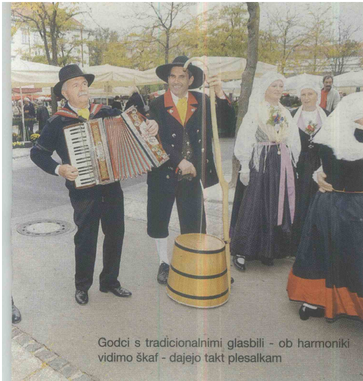
Godci s tradicionalnimi glasbili - ob harmoniki vidimo škaf - dajejo takt plesalkam