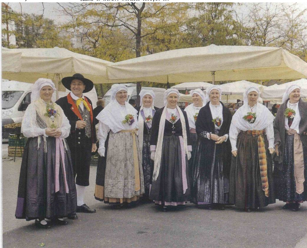
Kraški šopek se na ogled postavlja