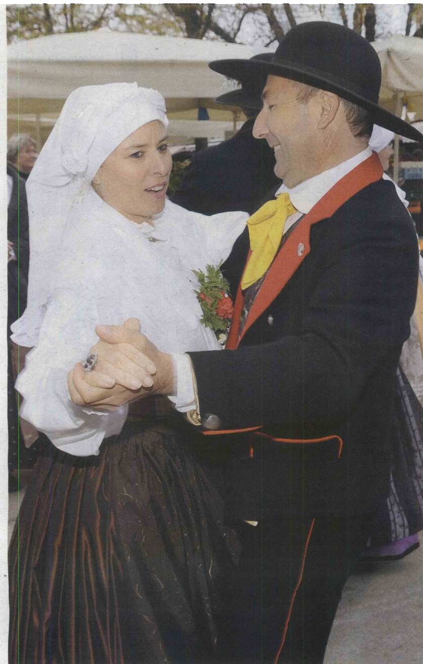
Moške noše so bile preprostejše od ženskih

nanje postopno prenašajo svoje znanje ljudskega petja, plesov, narodnih običajev in otroških iger. Društvo ima formalni sedež v Sežani, in tamkajšnja občina jim tudi finančno pomaga in jim gre na roko, če kaj potrebujejo.