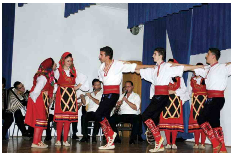
Te dni po Halozah igrajo, pojejo in plešejo folkloristi iz Ohrida.