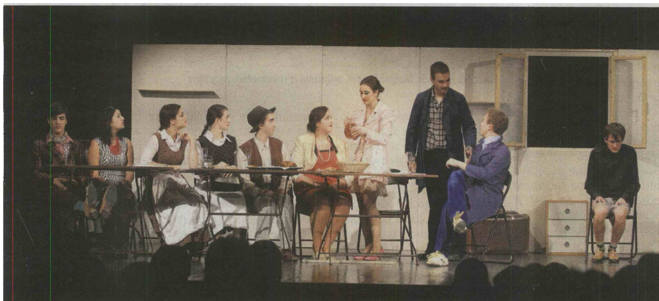
Prizor iz komedije Goli pianist ali Mala nočna muzika v izvedbi KUD Zarja Trnovlje