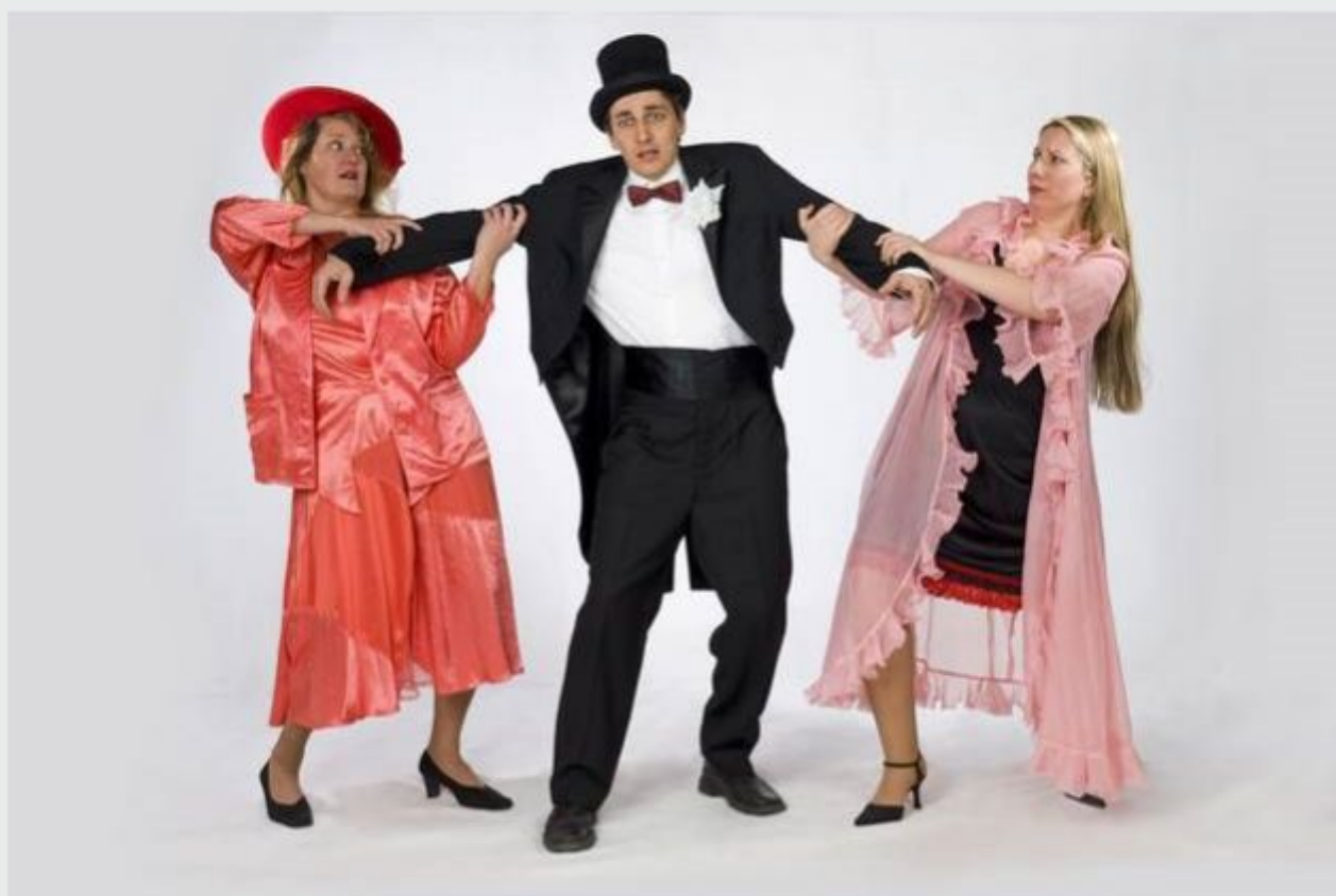
Zbeži od žene v izvedbi zamejske dramske skupine iz Štandreža pri Gorici.