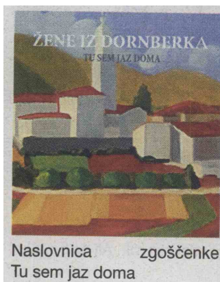
Naslovnica zgoščenke Tu sem jaz doma