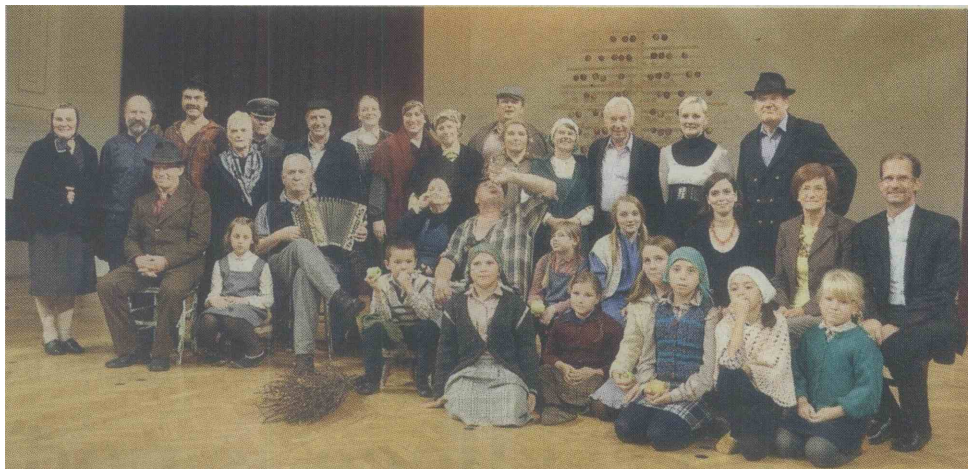
Primorska izbranka, bistriška folklorna skupina Gradina, na državnem srečanju folklornih skupin v Mariboru

S tem pevskim in plesnim spletom se je Gradina predstavila že na območnem srečanju folklornih skupin v Sežani ter na regijskem v Postojni. In bila izbrana med 14 najboljših iz vse Slovenije, ki so se predstavile na državnem srečanju v Mariboru. Tam so Bistričani znova navdušili strokovno vodstvo in občinstvo v dvorani. LORI FERKO