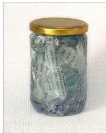
Tamara Rimele: Vložene kumarice, 2011.