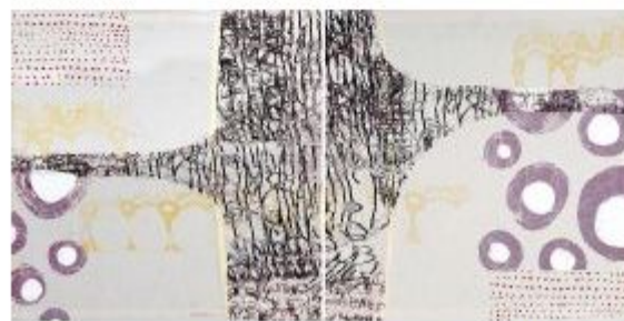
Renata Bedene, Kje se beseda rodi (diptih), 2011.