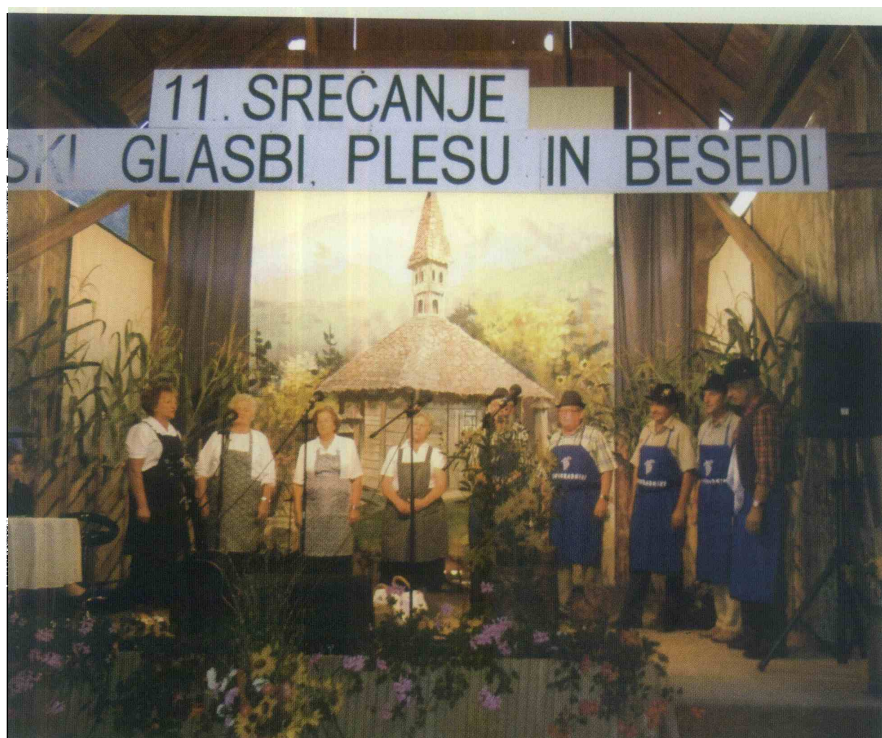
Gostje, ljudski pevci Vinogradniki iz Vidma pri Ptuj