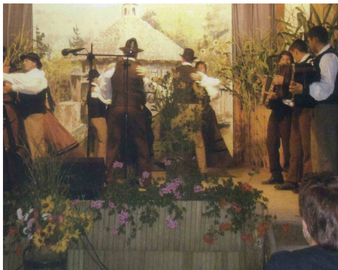
Folklorna skupina KD Prežihov Voranc Ravne na Koroškem