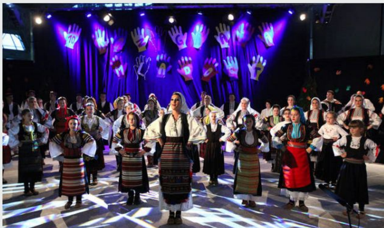
Dnevi srbske kulture

Marjana Hanc, Kranj sob, 20.10.2012, 21:00