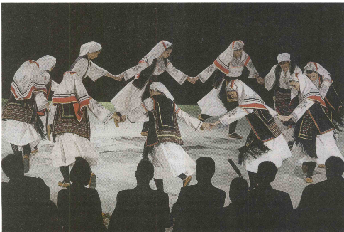
Plesalci Kulturnega društva Brdo so trikratni evropski prvaki.

ter srbski pisatelji in pesniki, ki živijo in ustvarjajo v Sloveniji, sledila je prireditev v Stražišču z naslovom Pesmi mojih prednikov. Vrhunec pa je bila sinočnja 10. mednarodna folklorna prireditev na Zlatem polju, hkrati tudi regijsko srečanje folklornih skupin manjšinskih etničnih skupnosti v skupni organizaciji KD Brdo in Javnega sklada RS za kulturne dejavnosti , območna enota Kranj, ki ga je obiskalo veliko gledalcev. Folkloristi, med njimi so bile tudi skupine iz Maribora, Trsta, Kranja, Radovljice in Nove Gorice, so navdušili predvsem zaradi svoje neizumetničnosti. Izkazali so se s predstavitev poročnih običajev iz Janja, spletom makedonskih plesov, plesi iz Rezije, igrami iz Glamocha in osrednje Srbije ter pesmimi in plesi iz Gnjan, Bujanovca, zahodne Slavonije in okolice Dimitrovrada.