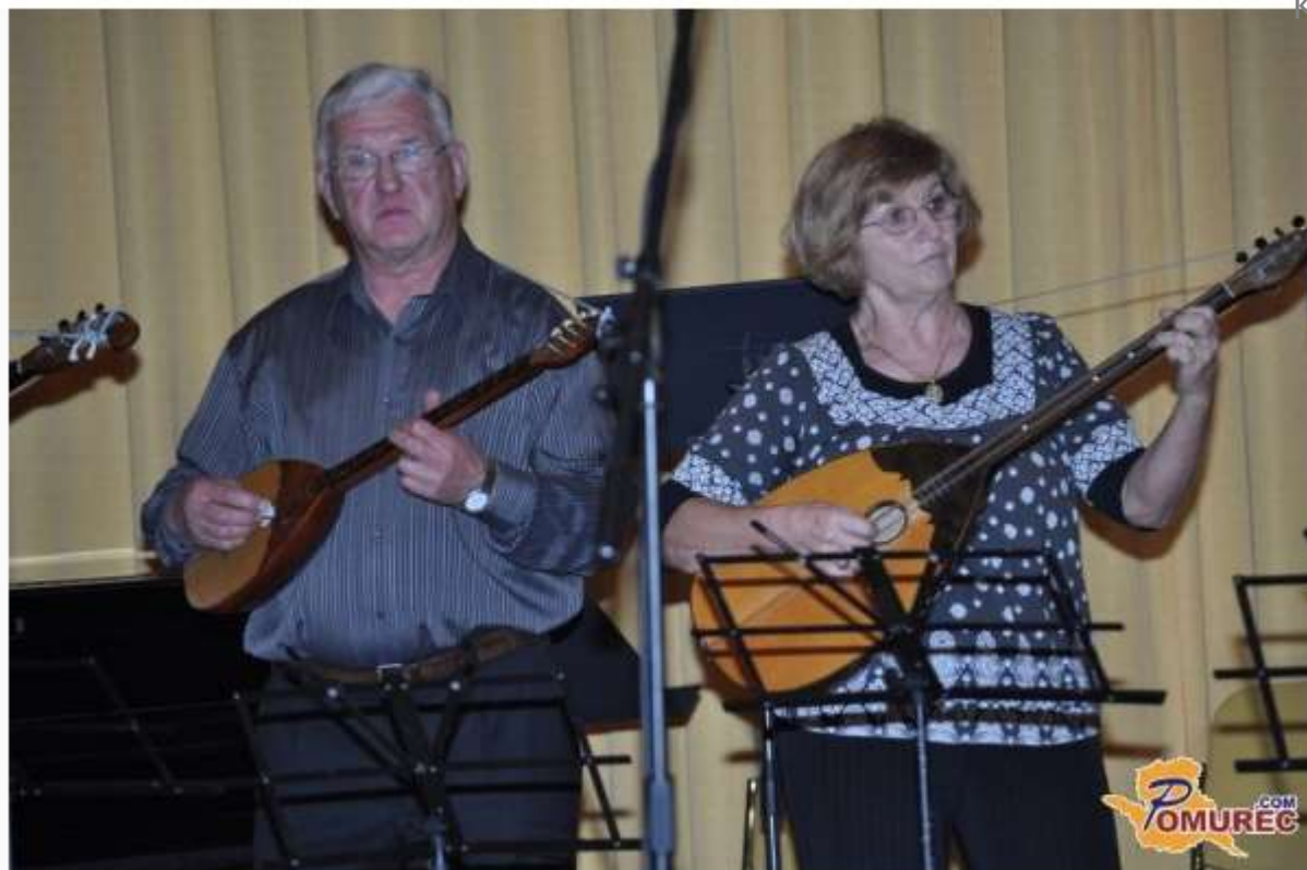
Več fotografij v spodnji galeriji...