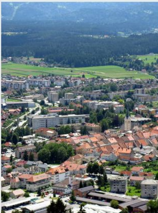
Slovenj Gradec

Mateja Celin, Slovenj Gradec sob, 20.10.2012, 18:00