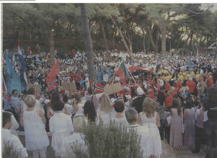
Na otvoritveni slovesnosti v parku nad mestom je vse vse vrvelo od dobrega razpoloženja, nič drugače ni bilo na koncu

Narodnik - JAVNI SKLAD RS ZA KULTURNE DEJAVNOSTI. Objave so namenjene interni uporabi v skladu z odločbami ZASP in se brez soglasja imetnika pravic ne smejo prosto razmnoževati in distribuirati! Kipin d.o.o.