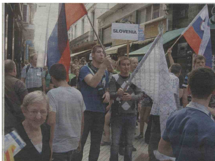
V povorki skozi mesto so bili slovenski pevke in pevci med najbolj razposajenimi