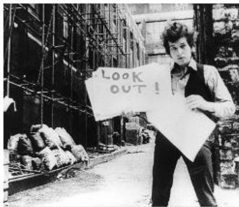
Natečaj sovpada z okroglo obletnico ustvarjanja Boba Dylana in je obenem svojevrsten odgovor na čase, ki vpijejo po angažirani refleksiji.