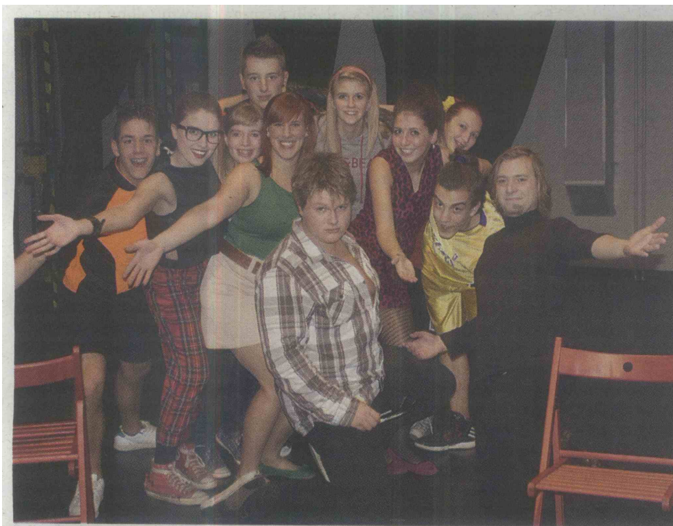
Tik pred najnovejšo premiero: nastopajoči v predstavi Pojma nimam