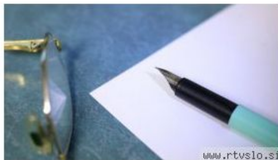
Natečaj Mentorjev feferon je revija pripravila pod okriljem Javnega sklada RS za kulturne dejavnosti (JSKD).