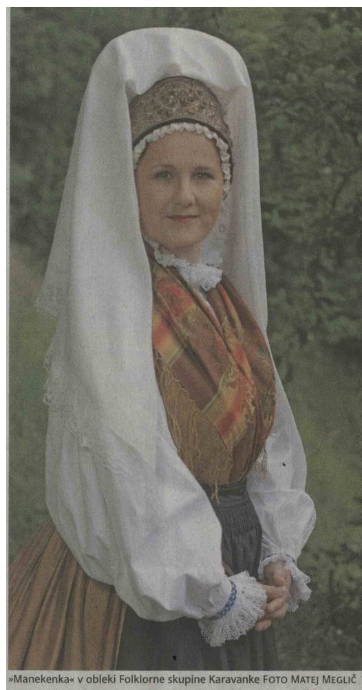
»Manekenka« v obleki Folklorne skupine Karavanke

»Vsaka vas ima svoj glas, vsak človek ima svoj glas, svoj način govora in po njem se navsezadnje tudi prepoznamo.«