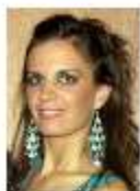
FOTO: Fronta tudi sinoči ponudila obilo plesnih užitkov