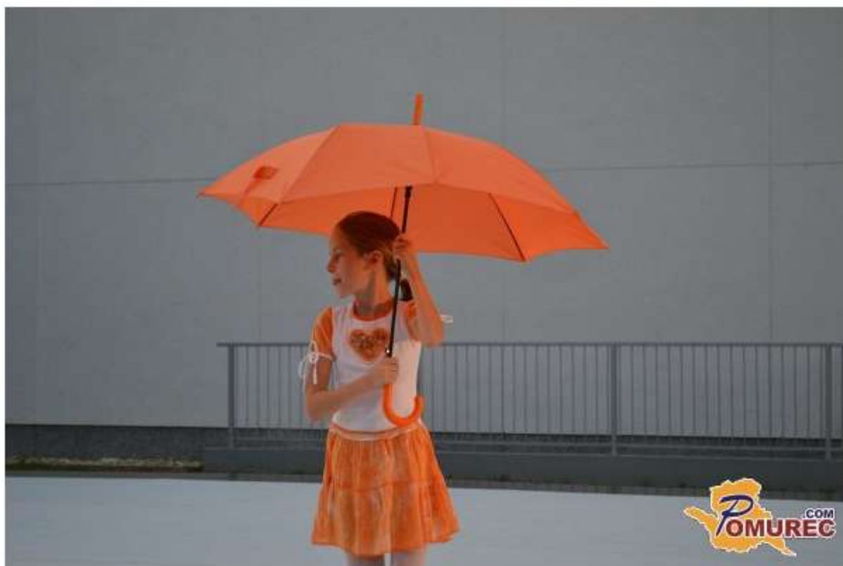
Več fotografij v spodnji galeriji ...