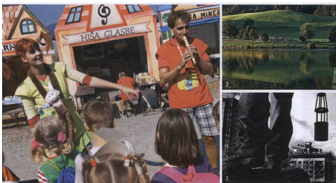
1_Festival Pika Nogavička privabi najmlajše od daleč in blizu. 2_Čeprav precej industrijsko, ima Velenje z okolico mnogo naravnih lepot. 3_Javni spomenik- kip rudarja.