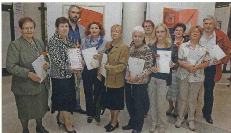
Nekateri od razstavljalajočih na razstavi v Sežani

Razstava, ki bo v Sežani še na ogled do 26. septembra, se nato seli v Koper, od tam pa še v Postojno, Ilirsko Bistrico in Izolo. V februarju naslednje leto naj bi bila z izborom izmed in del, ustvarjenih na isto temo na severno primorskem območju še ena, tokrat pokrajinska razstava. BOGDAN MACAROL