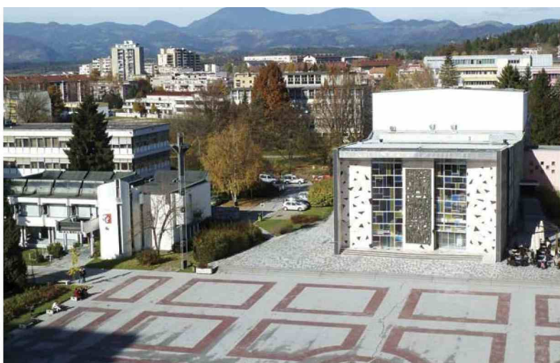
Velenjčani jutri slavijo v spomin na leto 1959, ko so odprli novo mestno središče. (Franc Kramer)