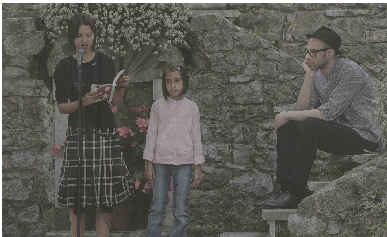
Vilenica 2010; Društvo slovenskih pisateljev organizira rezidence tudi v povezavi s tem festivalom. Fotografija je simbolična.

Nekateri pisatelji nimajo več stalnega bivališča, marveč romajo z ene rezidence na drugo.