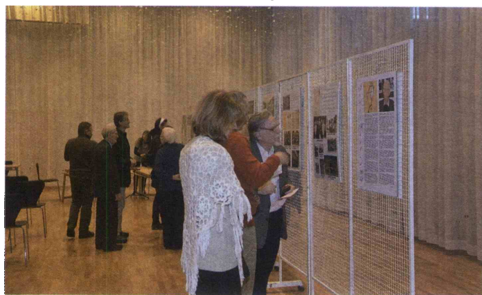
Razstava o življenju in delu Janeza Karlina je na ogled v Aninem dvoru.