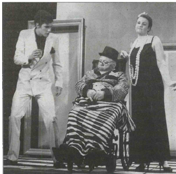
Umor v vili Roung v izvedbi dramske skupine F.B. Sedej iz Števerjana