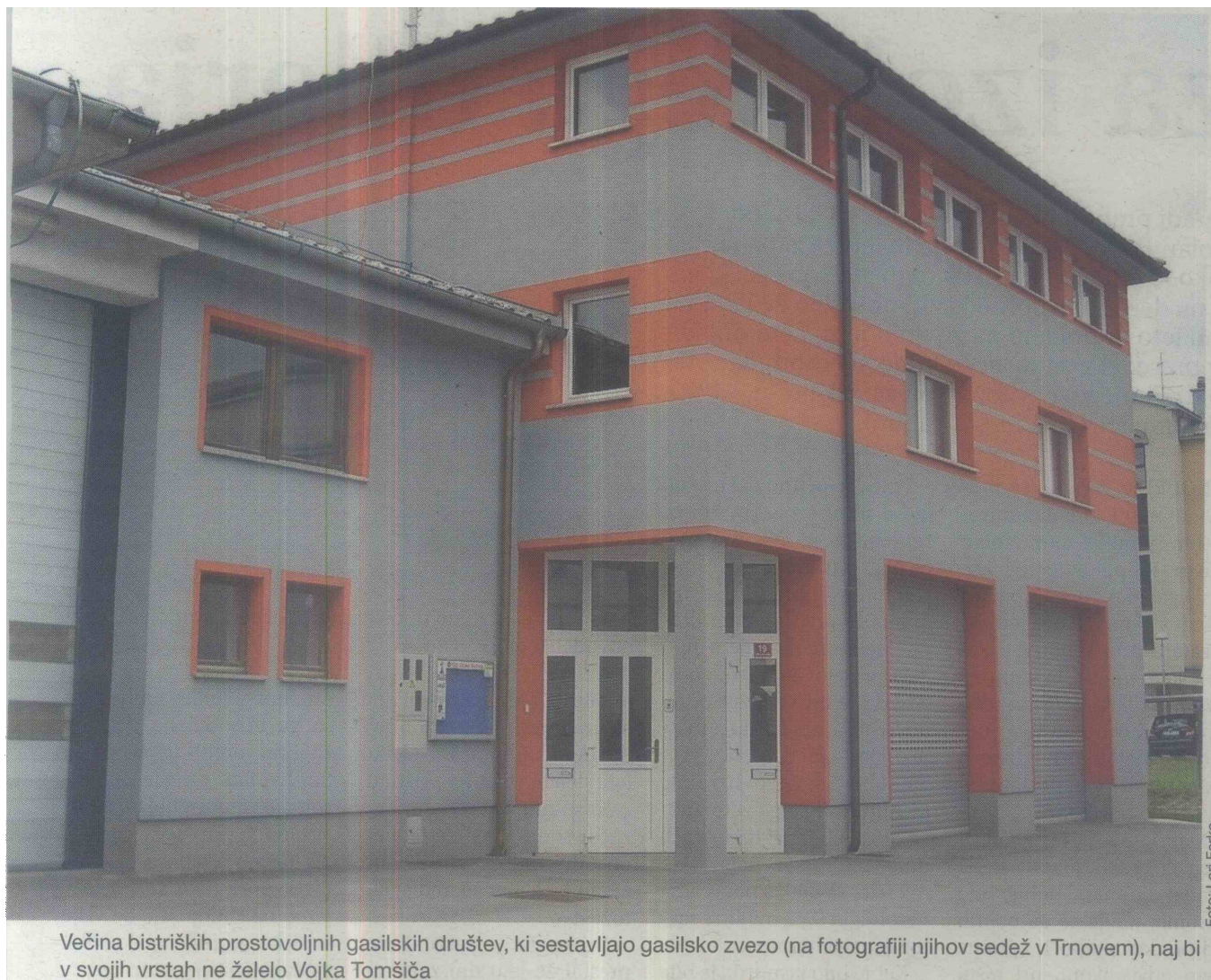
Večina bistriških prostovoljnih gasilskih društev, ki sestavljajo gasilsko zvezo (na fotografiji njihov sedež v Trnovem), naj bi v svojih vrstah ne želelo Vojka Tomšiča

na podžupanovo povelje v začetku letošnjega leta bistriška občina ne želela izplačati zahtevkov za financiranje javne gasilske službe, ker naj bi mu neformalno v večini društev odrekli podporo na volitvah. "Na to nisem vplival, ampak sem o sporu med gasilci in županom izvedel šele iz medijev," je poudaril Tomšič, ki nam je pred