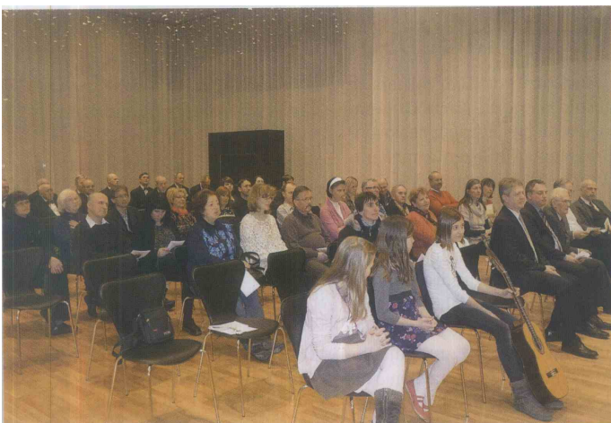
Zanimiva tema je privabila številne obiskovalce.