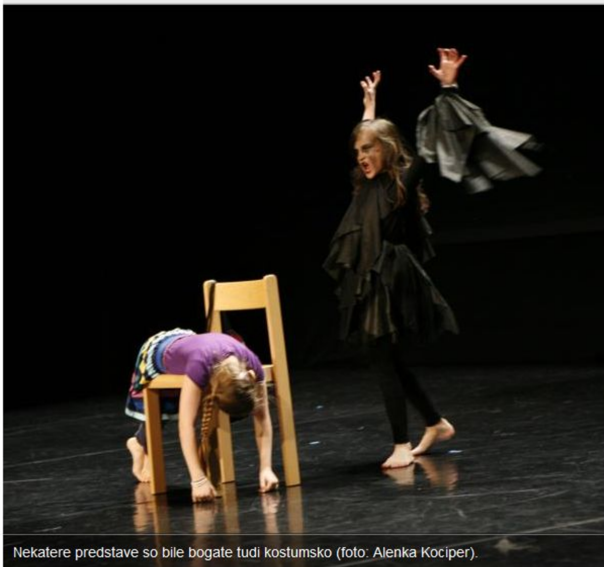
Nekatere predstave so bile bogate tudi kostumsko.

Center kulture Španski borci v Ljubljani je v soboto gostil mlade plesalce sodobnega plesa. Enaindvajseto mednarodno tekmovanje Opus 1 – plesna miniatura 2013 pod naslovom Vsi marš na ples, katerega skupni imenovalac je bilo geslo ples in upor, je potekalo v organizaciji Javnega sklada RS za kulturne dejavnosti (JSKD).