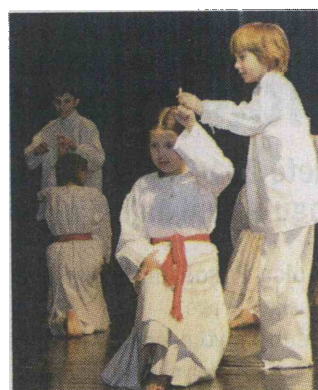
Po zgledu starejših