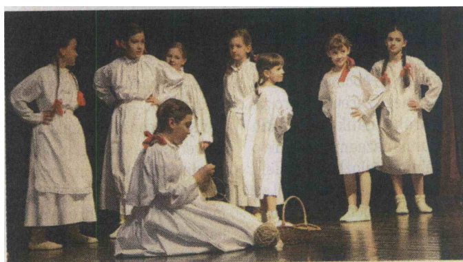
Otroške igre, pesem in ples je prikazalo kar 280 otrok iz Bele krajine.