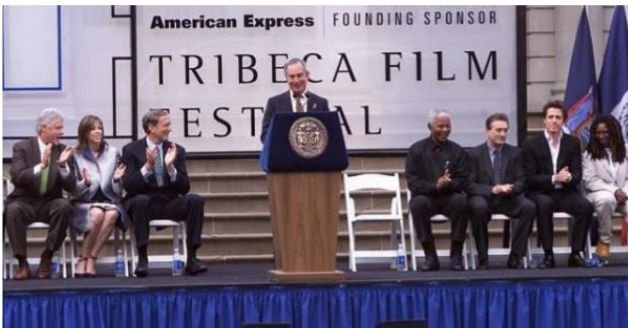
Do konca aprila bo festival ponudil filme vseh žanrov ...

S projekcijo dokumentarca Mistaken for Strangers (Zamenjani za tujce) o indie bandu The National in koncertom skupine se bo začel 12. newyorški festival neodvisnega filma Tribeca (Tribeca Film Festival). Do zaključka, 28. aprila, bo festival ponudil vse, od novih stvaritev do poklona starejšim filmom.