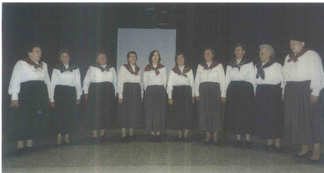
Ljudske pevke KUD-a Budinci so se predstavile v novi oblačilni podobi, ki jo je za njih pripravila Lili Šiftar.

Petindvajsetletnica domačega kulturno-umetniškega društva