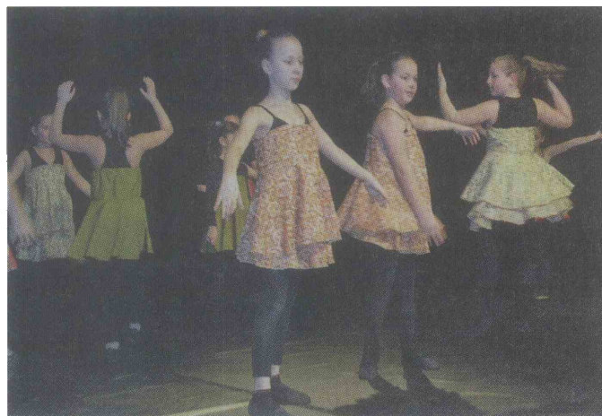
PLES IN GIB 2013 - OI JSKD je preteklo sredo pripravila že tradicionalno območno plesno revijo Ples in gib. V dveurnem programu se je zbranim v dvorani Šeškovega doma Kočevje predstavilo kar 18 plesnih skupin iz KUD Godba Kočevje, Plesnega kluba Jasmin, Plesnega studia Rusalka, Glasbene šole Kočevje, OŠ Ob Rinži in plesne skupine OK Založba. Revijo je strokovno spremljala Petra Pikalo.