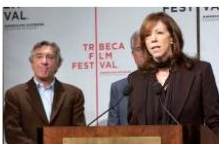
Ustanovitelja festivala neodvisnega filma Tribeca Robert De Niro in Jane Rosenthal

V soj žarometov se bodo zagotovo ujeli dokumentarci o znanih osebnostih, ko so broadwayska zvezdnica Elaine Stritch , igralec Richard Pryor in scenarist Gore Vidal .