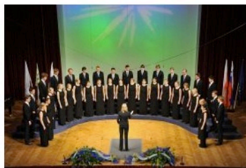
Švedski zbor so odlikovali zelo lep in homogen zvok, dobra intonacija, dober in tehten program ter dovolj prepričljiva izvedba.