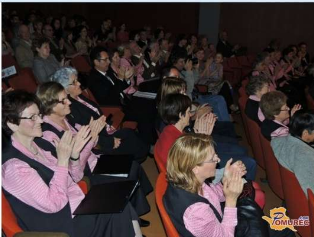
Več fotografij v spodnji galeriji...