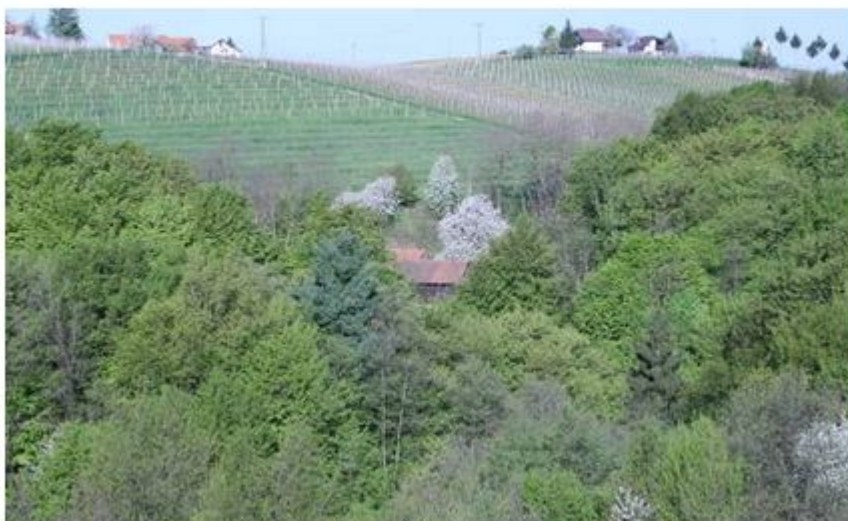
Dolina, v kateri je odraščal Franc Miklošič.

Iz svojega doma se lahko vsak trenutek ozrem proti strehi Miklošičeve domačije, spodaj v dolini. In tudi se in sploh ne zaradi dvestote obletnice njegovega rojstva (mimogrede, dvestoto letos praznuje tudi Søren Aabye Kierkegaard, pa Giuseppe Verdi in Richard Wagner). Oziram se iz globokega spoštovanja do človeka, ki je iz revne kolibe zakorakal v veliki svet in mu po svoji moči pomagal, da je postal - v njegovem primeru - jezikovno strokovnejši. Ali bodo in bomo to po svojih močeh zmogli tudi mi, pa naj se vpraša vsak sam.