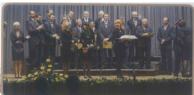
Ob praznovanju so za presenečenje poskrbeli člani Mešanega pevskega zbora Vineca in slavljencem prinesli torto.