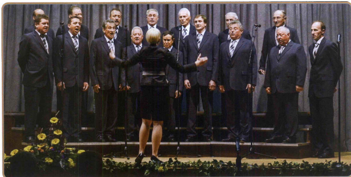
Moški pevski zbor Kozje ljubezen do petja druží že 35 let.