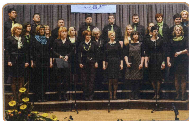
V goste so povabili Mešani pevski zbor Vineca.