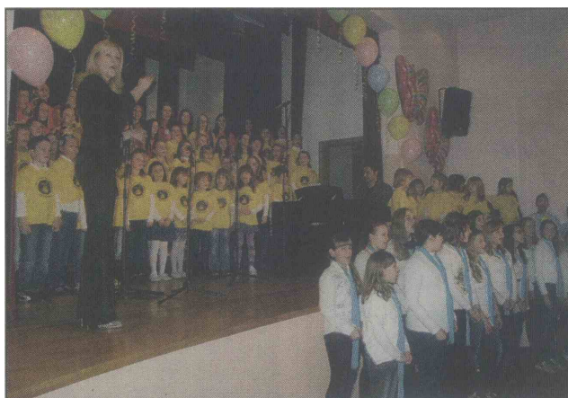
Z revije »Poj z menoj« v Boštanju