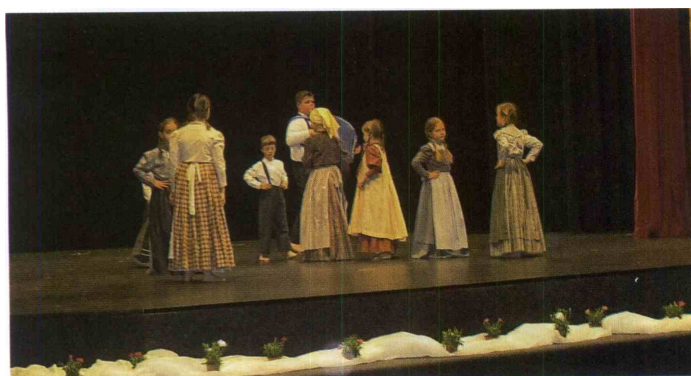
Zaplesala je tudi konjiška Otroška folklorna skupina – KUD-a Jurij Vodovnik Skomarje.