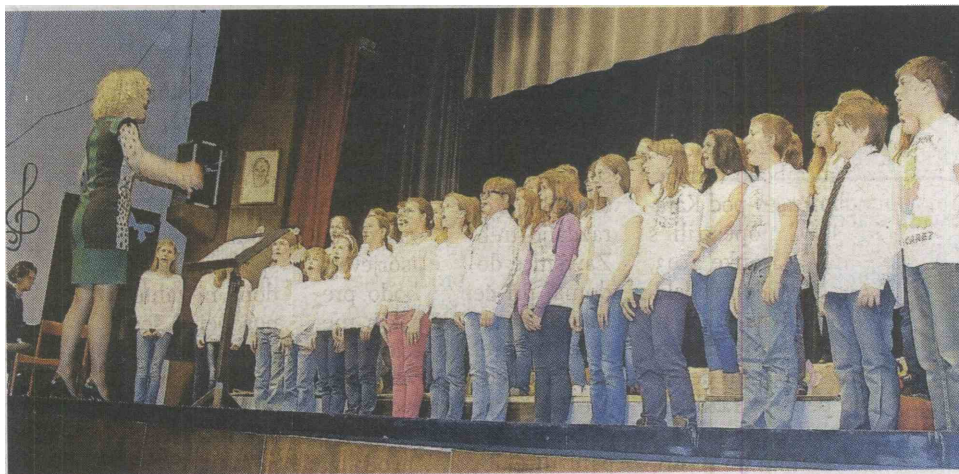
Mladinski pevski zbor OŠ Koroška Bela