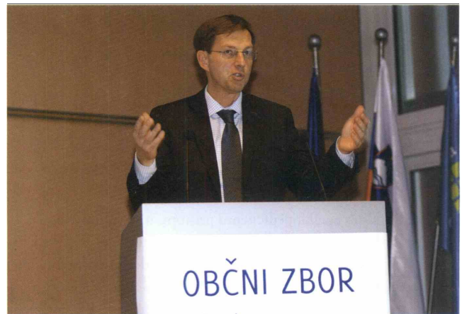
Prof. dr. Miro Cerar: »Gospodarstvo je lahko dolgoročno uspešno le, če je etično.«