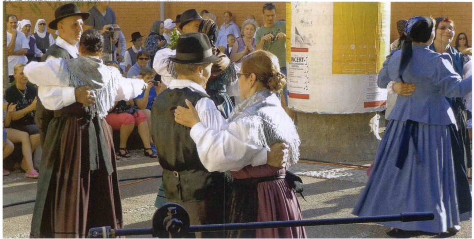
FS MČ Slavka Šlandra je s folklornimi nastopi tudi letos izpolnila pričakovanja občinstva. Foto Marjan Vižin

V Mestni četrti Slavko Šlander so uredili osrednji prostor med pošto, trgovino, cvetličarno in bifejem Kaktus v Ulici V. Prekomorske brigade. Štiri grede so bile na novo zasajene z grmovnicami in raznim cvetjem. Vendar so se kmalu pokazale pomanjkljivosti. Lastili so si jih otroci za igranje in psički za lulanje in kakanje. Zato so jih ogradili s trdno ograjo, ki zdaj hkrati služi za naslonjalo tistim, ki sedejo na klopi, s katerimi so obdane grede. MČ je pridobila tudi štiri parkirna mesta na Ljubljanski cesti od št. 26 do 30 in eno klop na vezni poti med Šerčerjevo ulico in Plavo laguno.