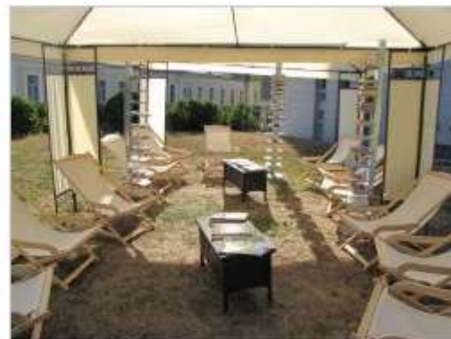
Poletna bralnica v Parku Rastoča knjiga Novo mesto