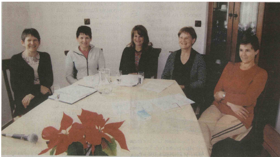
Tako se ob prepevanju ljudskih pesmi že vrsto let zbirajo pojoče sestre Jakob.