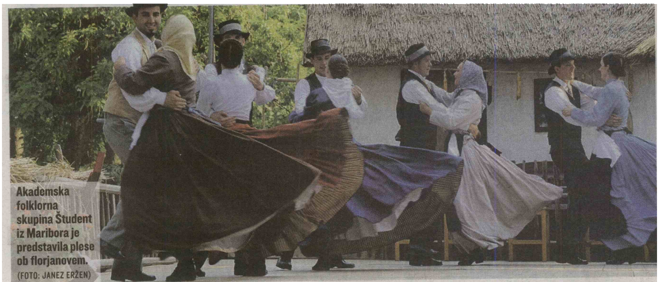
Akademška folklorna skupina Student iz Maribora je predstavila ples ob florjanovem.

umetniškega društva Tine Rožanc iz Ljubljane, in trio Volk Folk, družinski godčevski trio iz Ilirske Bistrice. Ob državnem srečanju najboljših folklornikov so pripravili tudi izobraževalni delavnici, pevsko in godčevsko, ki sta bili namenjeni spoznavanju preteklih tovrstnih glasbenih vsebin in doživetij ter njihovemu vključevanju v sodobnost. D. V.