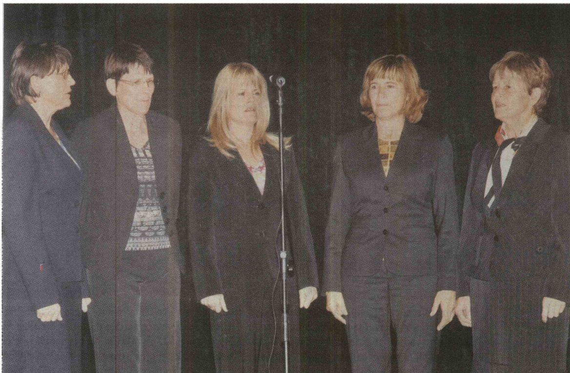
Z enega od koncertov pojočih sester Jakob, ki ohranjajo ljudske pesmi. Veliko so se jih naučile od staršev in sosedov.