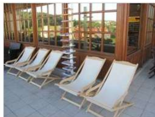
Poletna bralnica na terasi Knjižnice Mirana Jarca Novo mesto