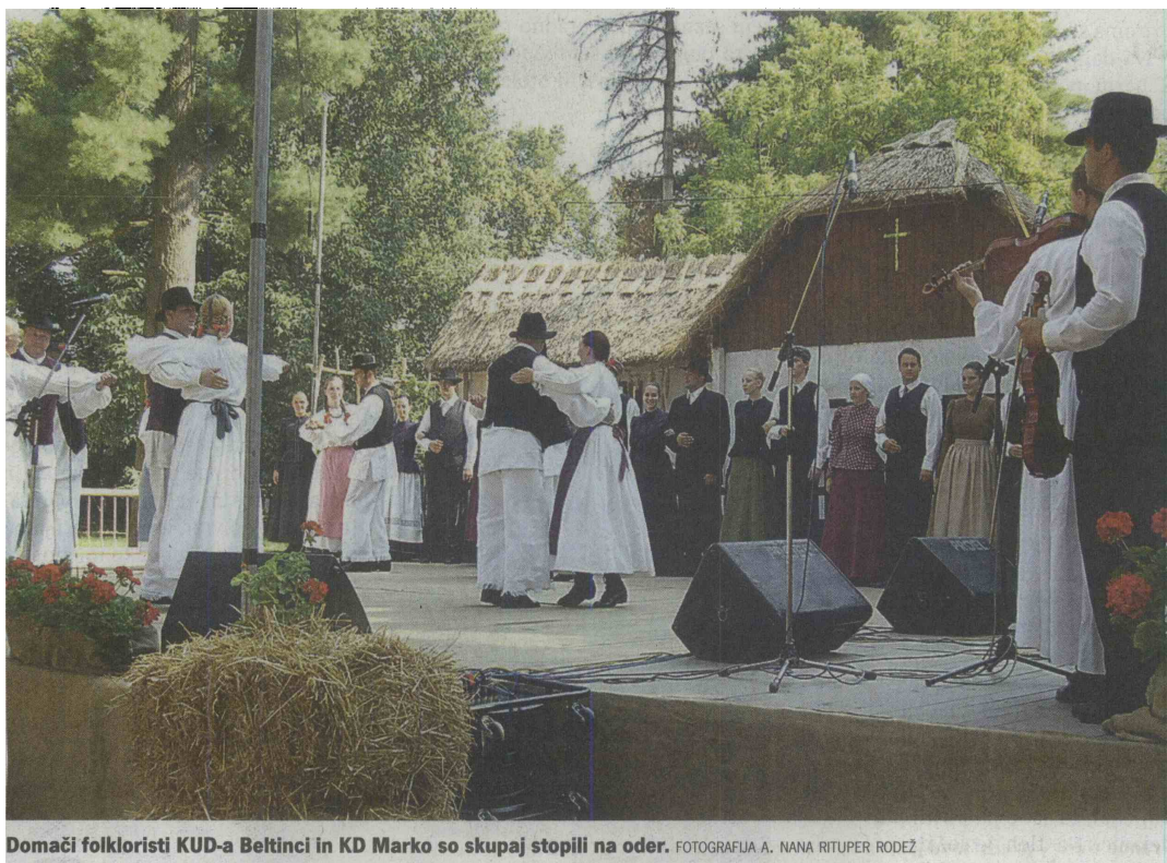
Domači folkloristi KUD-a Beltinci in KD Marko so skupaj stopili na oder.