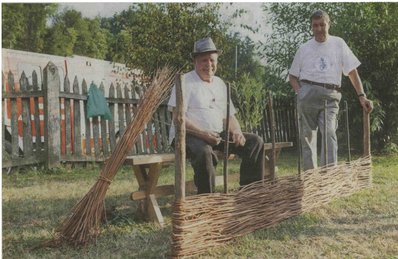
Tako so nekoč pletli plot iz vrbovih šib.