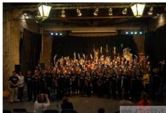
Na 33. tradicionalnem taboru Zveze slovenskih godb in JSKD-ja Musica Creativa se je zbralo več kot 110 mladih godbenic in godbenikov, ki bodo pridobivali nova znanja in se družili ob glasbi.