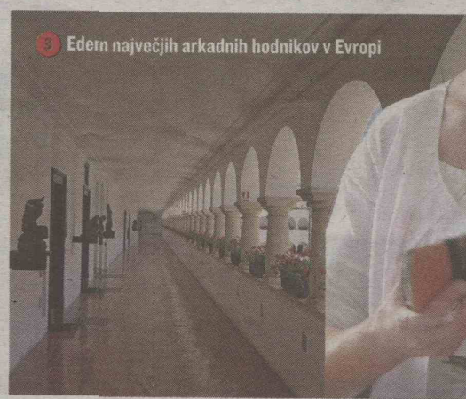
3 Ederne največjih arkadnih hodnikov v Evropi