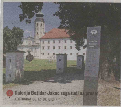
1 Galerija Božidar Jakac sega tudi na prosto.