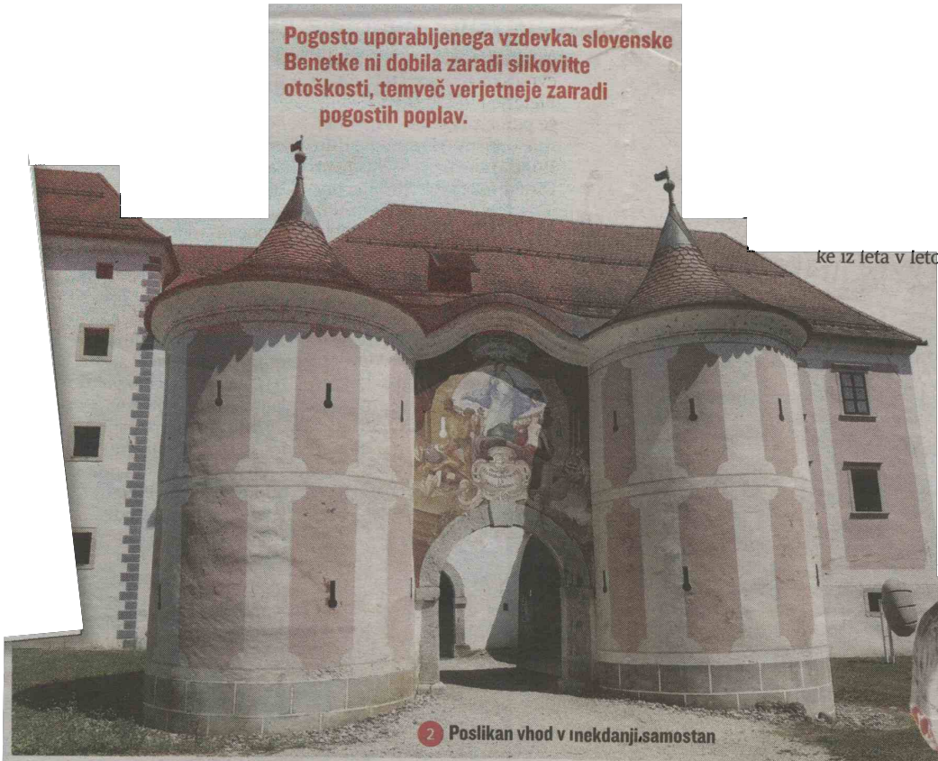
2 Poslikan vohod v Inekdanji samostan

Pogosto uporabljenega vzdevka slovenske Benetke ni dobila zaradi slikovitte otoškosti, temveč verjetneje zaradi pogostih poplav.