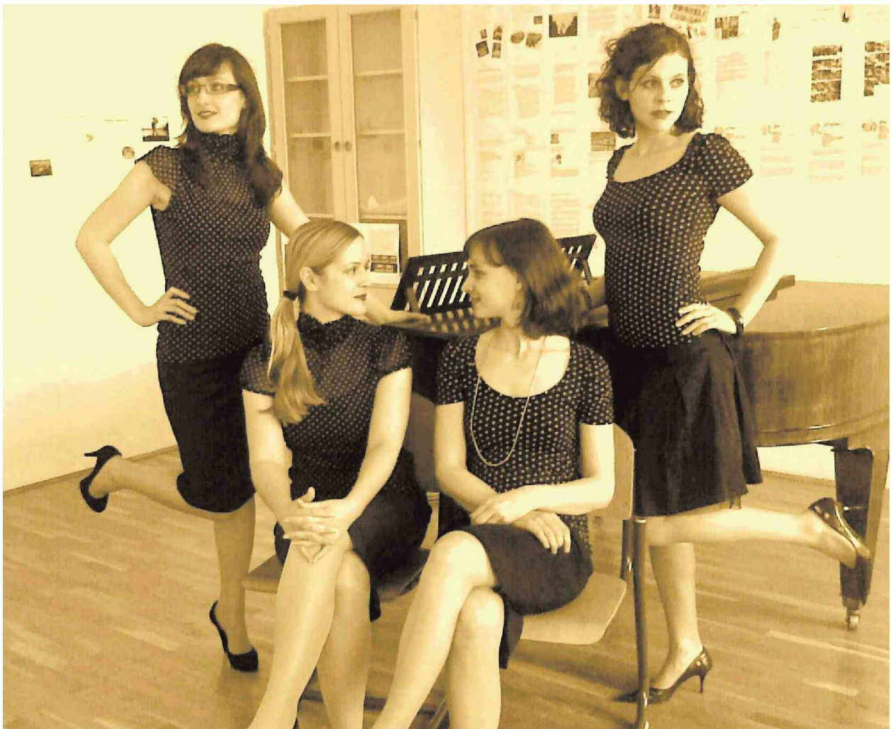
Dekleta iz vokalne skupine Gallina prinesejo s sabo na oder tudi ženstvenost, živahnost in razigranost.