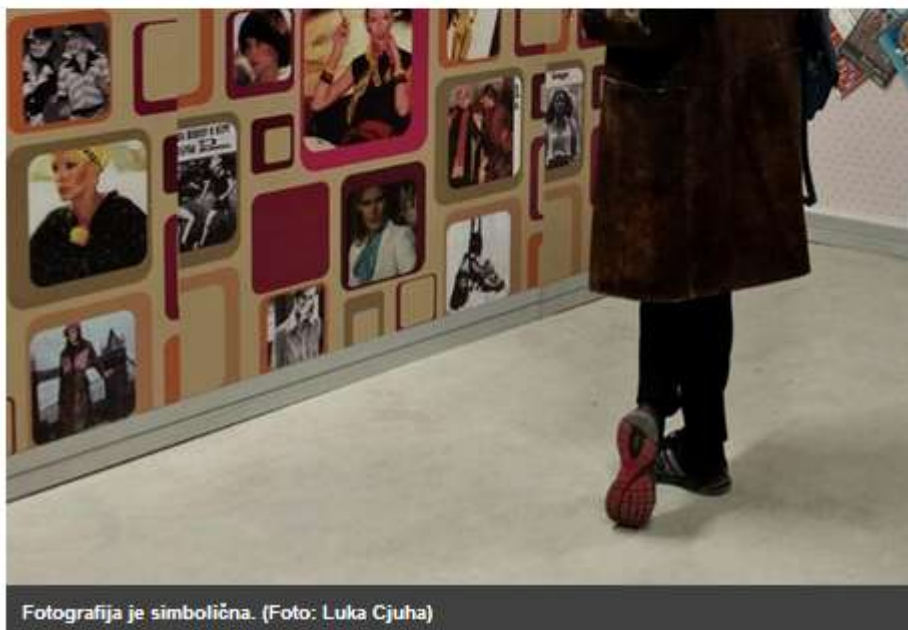
Fotografija je simbolična.

Na današnjo obletnico rojstva Franceta Prešerna bo pod geslom Ta veseli dan kulture ponovno mogoče zaužiti obilico brezplačnih kulturnih in umetniških dogodkov.