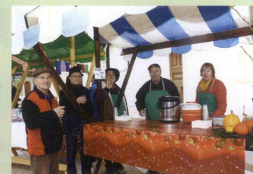
Društvo vinogradnikov Šentjur.