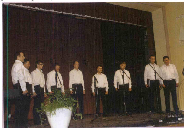
Moški pevski zbor Planina pri Sevnici