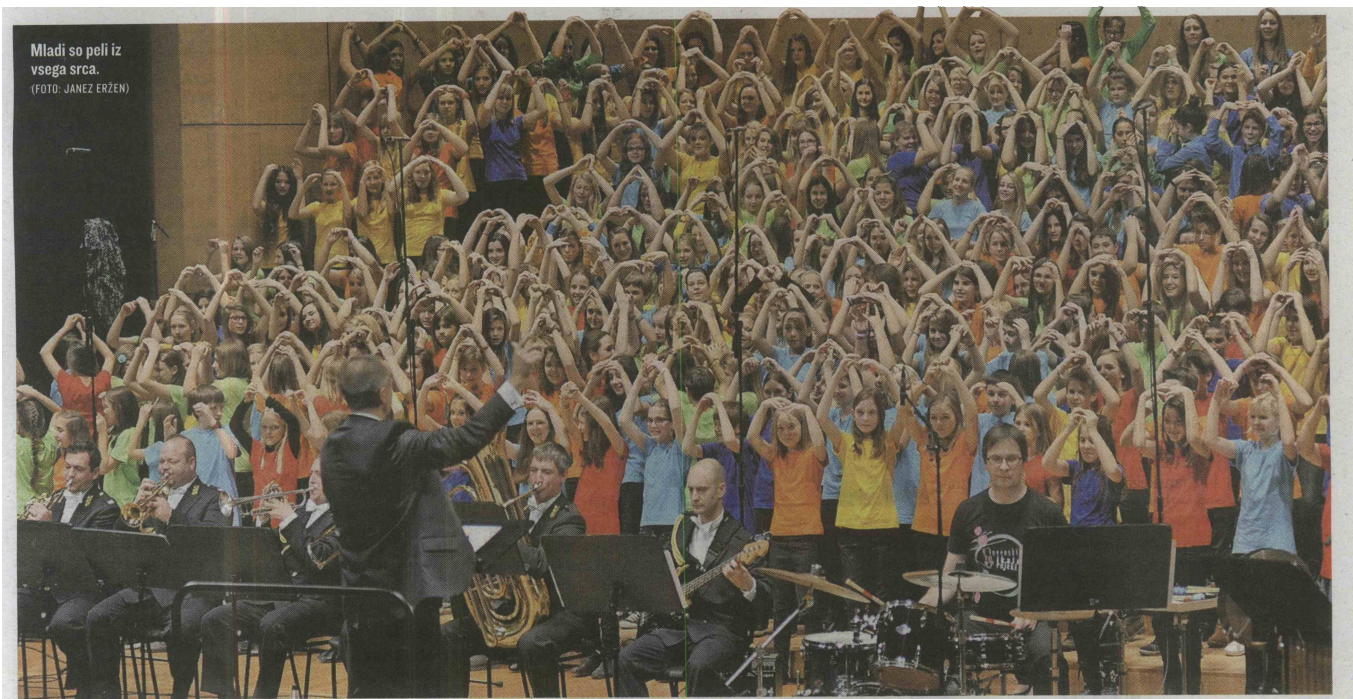
Mladi so peli iz vsega srca.