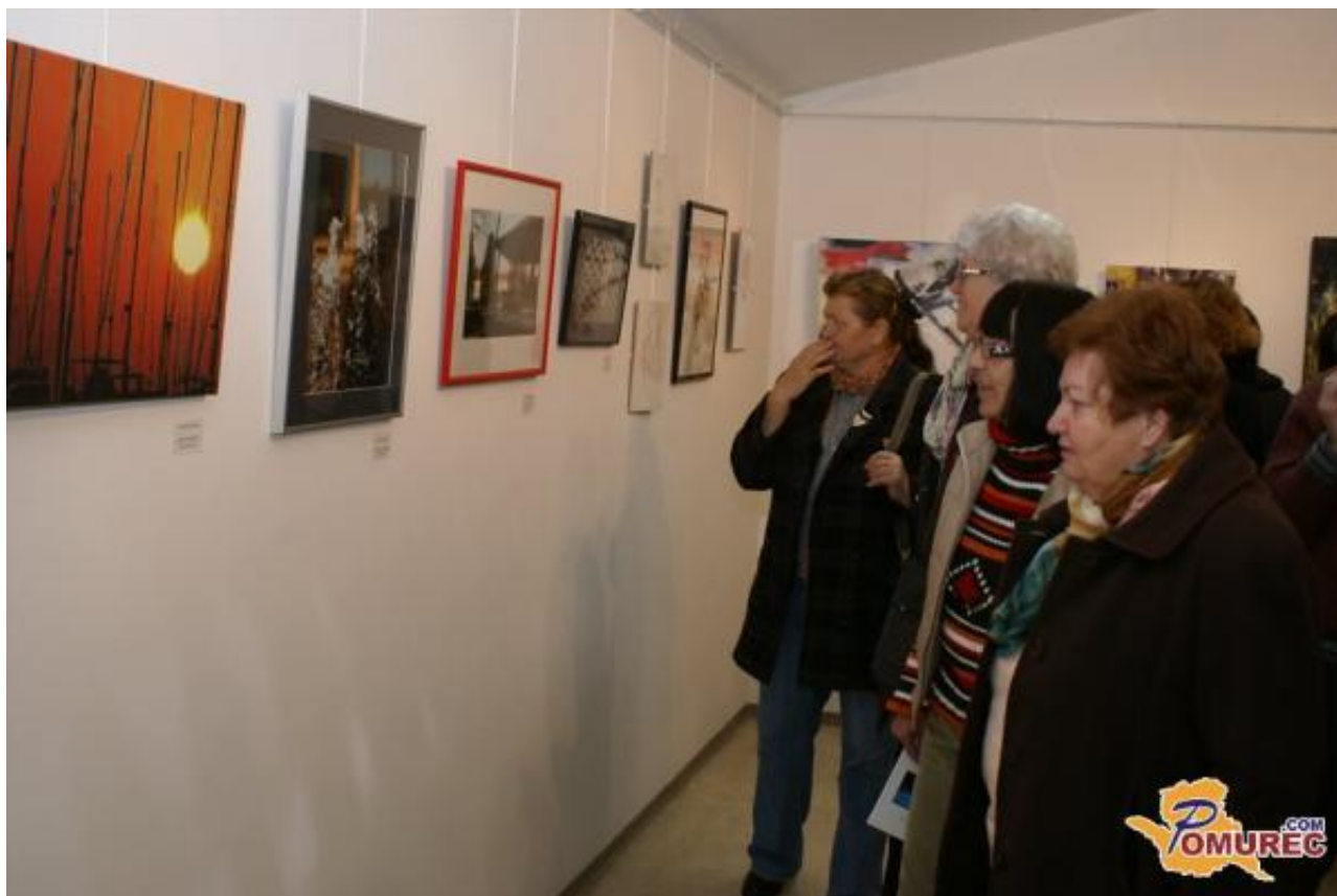
Več fotografij v spodnji galeriji ...