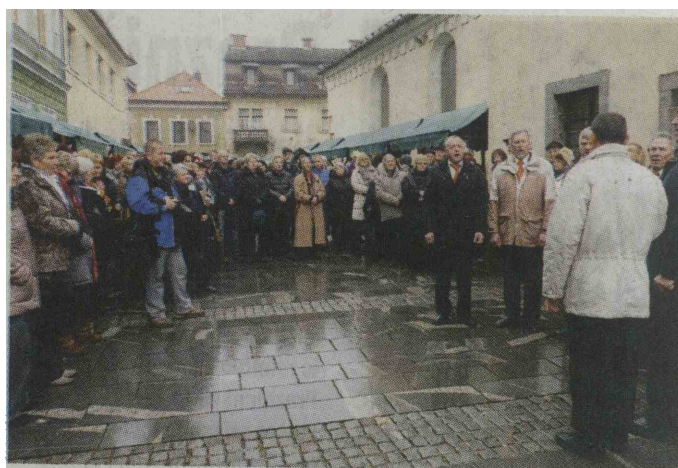
PESEM IZ MNOGIH GRL - Turistično društvo Črnomelj in črnomaljska območna izpostava JSKD sta preteklo soboto popestrila dogajanje na črnomaljski tržnici. Ob mednarodnem dnevu zborovskega petja sta pripravila tradicionalni koncert belokranjskih pevskih zborov, ki mu je sledil še nastop Preloških muzikantov. Trg je bil poln pevcev in poslušalcev. Nastopili so pevski zbor Društva upokojencev Črnomelj, grajski pevci iz Predgrada, mešani pevski zbor Društva upokojencev Semič, pevski zbor Otona Župančiča Društva invalidov Črnomelj, pevska skupina Dobra volja je najbolja s Sinjega Vrha, vokalna skupina Vocalis iz Metlike, oktet Prelo iz Adlešičev in mešani pevski zbor Samospev iz Črnomlja.