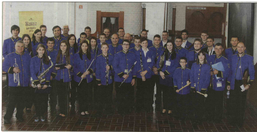
Pihalna godba Markovci