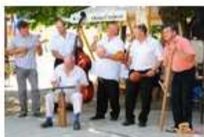
FOTO: Otvoritev 20. Mlinarskih dnevov v Kantini