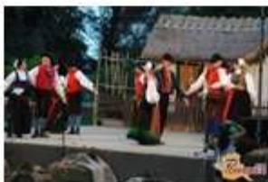
FOTO: Na folklornem festivalu v Beltincih večer tuje glasbe