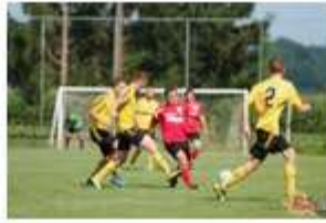
FOTO: Nogometni turnir v Bogojini dobila Čarda