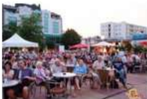
FOTO: Včeraj na Soboškem poletju nastopil narodni orkester iz Novega Sada