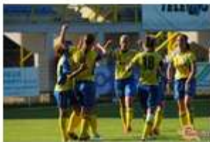
FOTO: Nogometašice Teleing Pomurja za začetek porazile madžarske podprvakinje