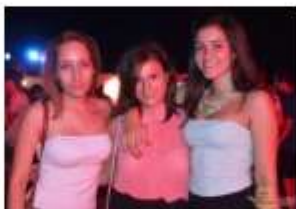
FOTO: Tretji del Heineken Open Air Clubbinga poskrbel za vročo zabavo