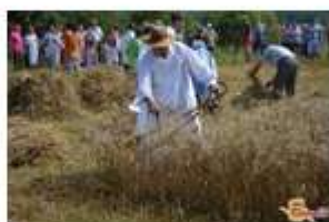
FOTO: V Domanjševcih želi in peli kot nekoč