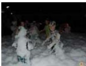
Pena party na Glavnem trgu v Ljutomeru