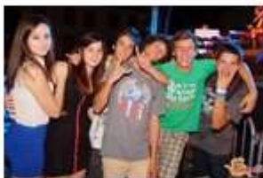
FOTO: Priška poletna noč v Ljutomeru že sedmič