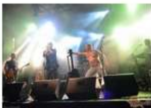
FOTO: Boris Novkovič popestril vročo poletno noč v Termah 3000