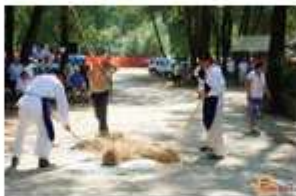
FOTO: Kulturno pestri in z bogato kulinariko Mlinarski dnevi