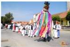
FOTO: Zaključek 43. Mednarodni folklorni festival Beltinci