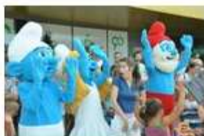
FOTO: Ples in zabava s Smrkci v Maximusu