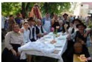
FOTO: Pestro sobotno dogajanje na mednarodnem folklornem festivalu v Beltincih