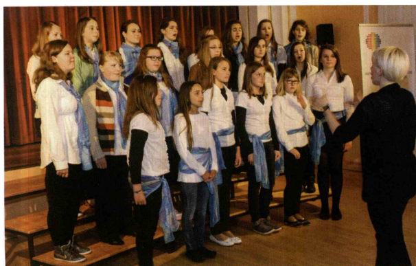
Prvič so na srečanju odraslih pevskih zborov nastopile pevke Dekliškega pevskega zbora La Vita.