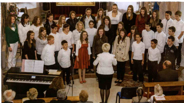
Mladinski pevski zbor OS Podčetrtek se je s ponosom predstavil s pesmima, ki sta jim dan poprej na regijskem tekmovanju prinesli srebro.