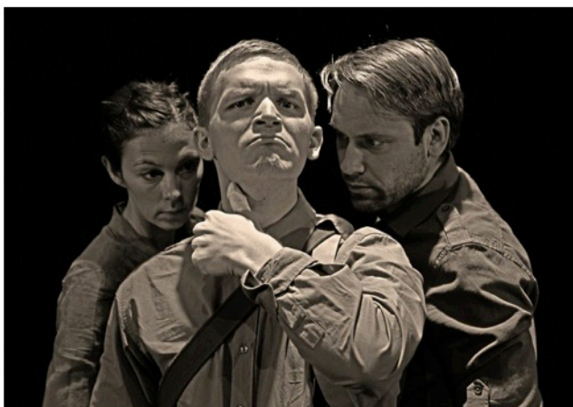
JANEZOV PASIJON

Vedno mi je bil najpomembnejši izziv, ki mi ga projekt zastavi. Po Misteriju Bufo , ki je bil relativno uspešna predstava, me je predvsem zanimalo, če mi lahko uspe izpeljati še en projekt z enako ekipo. S tega stališča so tudi vsi štirje igralci zelo zanimivi, saj imajo močan odnos in stik s politiko in zato tudi precej dobro izdelano stališče o današnji družbi. Odločili smo se za obliko pasijona, saj omogoča hiter prelet čez človeško življenje. Za začetek sem sestavil strukturo, načrt prizorov, ki pa smo ga skozi improvizacijo dodelali in osmislili. Zame je sodelovanje med igralcem in režiserjem bistveno – saj tako igralci kot drugi sodelavci lahko zelo veliko doprinesejo k predstavi, če jim znaš prisluhniti. Režiserjeva vloga je vloga motorja na čolnu sodelavcev – brez motorja čoln sicer bolj slabo pluje, brez čolna pa motor žalostno potone.