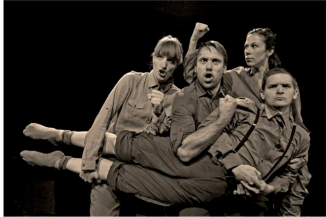
JANEZOV PASIJON