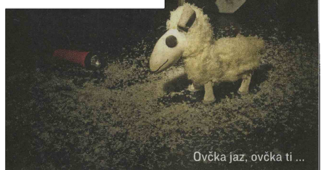
Ovčka jaz, ovčka ti ...

navdušenja izgubimo upanje in zapademo v apatijo. Delo je serija nesmislov, ki so jih narodi sovjetske revolucije