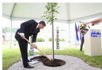
Takole je predsednik v roke vzel lopato in posadil lipo.

Ocena novice: ★★★★★ Vaša ocena: ★★★★★ Ocena 2,6 od 5 glasov Ocenite to novice!