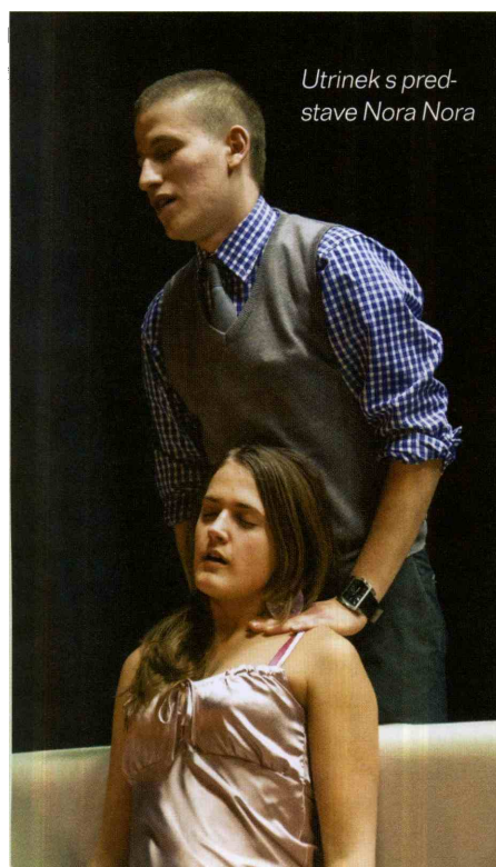
Utrinek s predstave Nora Nora

tivnost, sodobnost in avtorski pristop tako v besedilu kot odski postavitvi si je prislužilo ŽABA GLEDA & IŠČE, Prosvetno društvo Vrhovo. (M.N.)