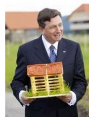
Predsednik je v dar dobil kozolec iz testa.