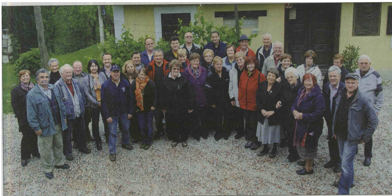
Skupinska fotografija pred Aškerčevo domačijo