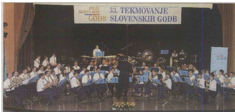
Levo: Godbeno društvo Prosek na 33. tekmovanju slovenskih godb v Žalcu, spodaj sobotni nastop mladinskega orkestra

Ob članskem si nabira izkušnje mladinski pihalni orkester, ki se je predstavil na festivalu Slavko Luxa