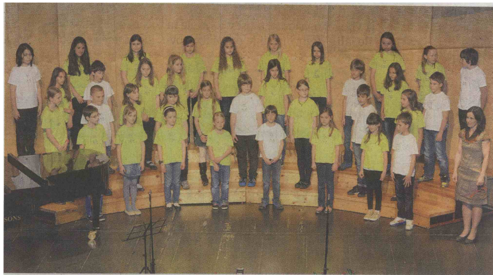
OPZ Gustava Siliha Velenje