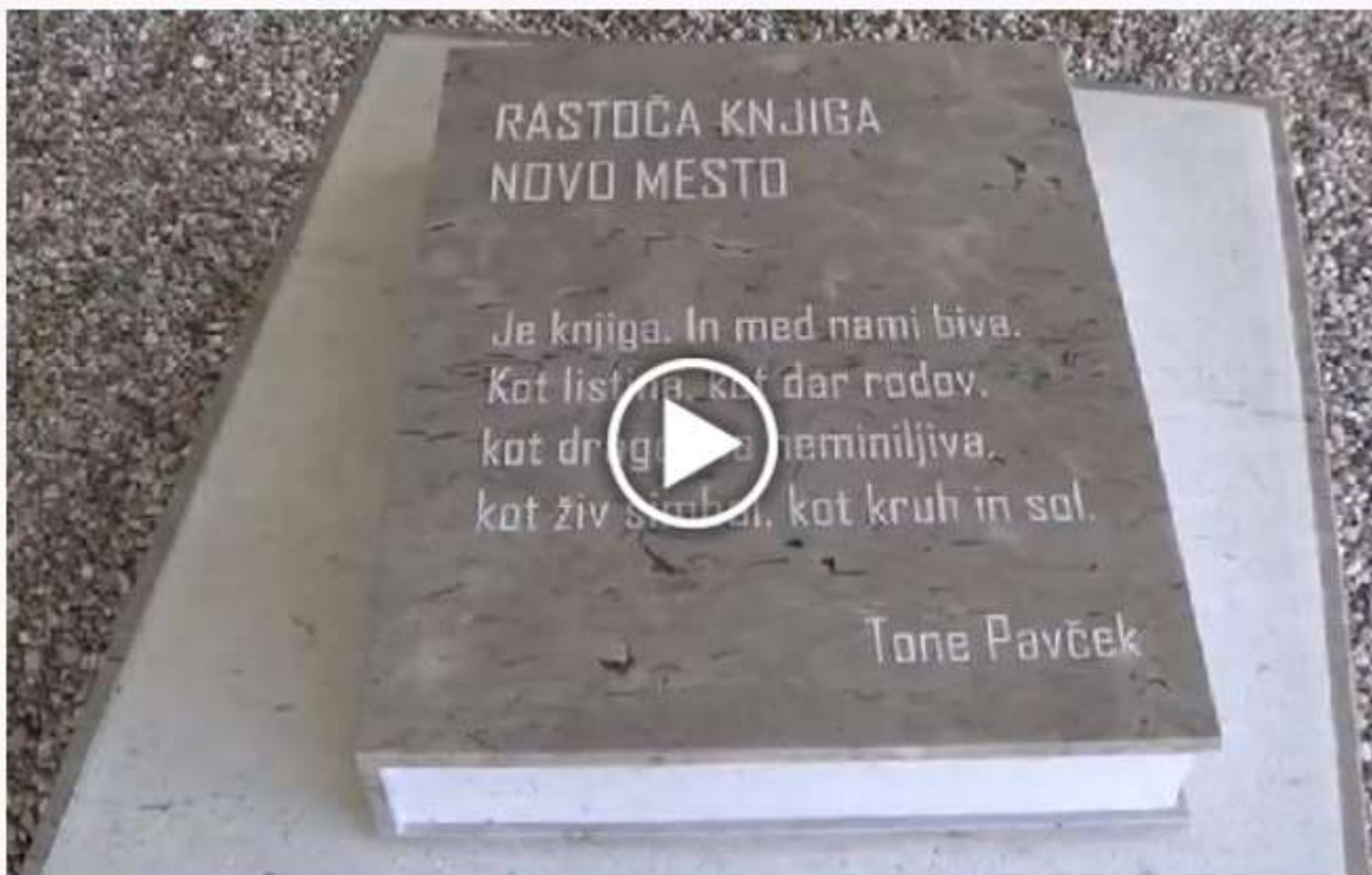
Rastoča knjiga Novo mesto