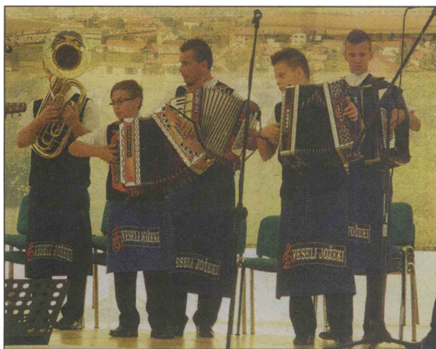
Veseli Jožeki so skupina z največ podmladka