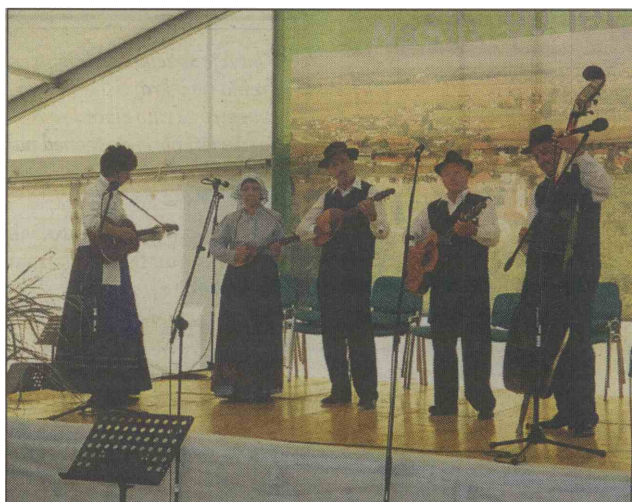
Uvodoma je na osrednji prireditvi v čast 90-letnici KD Franceta Prešerna Videm zaigral tamburaški kvintet.