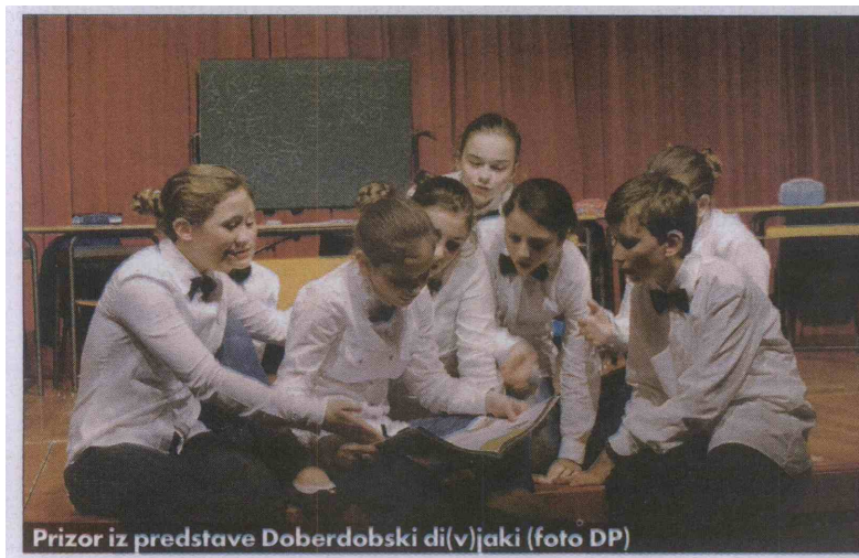
Prizor iz predstave Doberdobski di(v)jaki