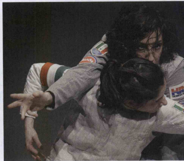
Predstava siena.