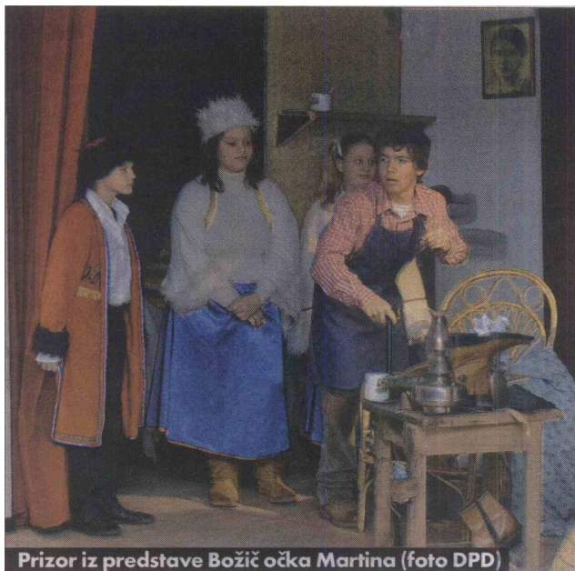
Prizor iz predstave Božič očka Martina