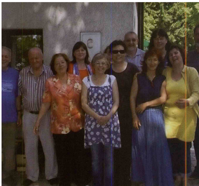
Literati, ki so se družili na Donački gori.

Člani slatinskega literarnega društva vabijo medse nove člane, literarne ustvarjalce iz Rogaške Slatine in okoliških krajev. Člani društva imajo velike možnosti za promocijo svojega dela, za objavljanje besedil in sodelovanje z ostalimi literarnimi društvi. Mlado društvo želi postati prepoznavno s svojim uspešnim delovanjem in bolj množično. Vabljeni k sodelovanju!