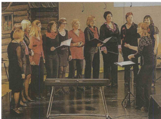
Na Naših sopotjih je nastopila tudi ženska skupina Plamenke iz Preddvora.