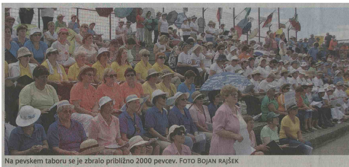
Na pevskem taboru se je zbralo približno 2000 pevcev.