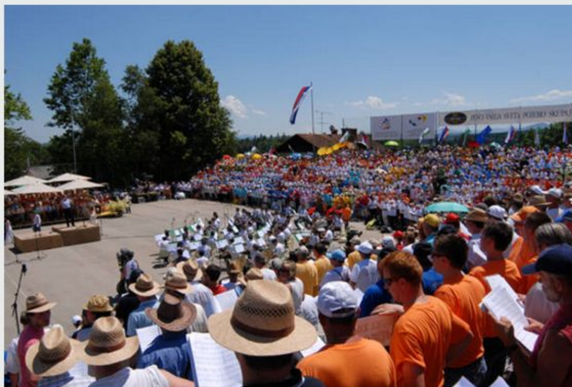
Slovenska pesem in množica ubranih glasov v Šentvidu pri Stični.

Tradicionalnega srečanja pevskih zborov v Šentvidu pri Stični se vsako leto udeleži več kot sto zborov iz Slovenije in tujine in velja za najbolj množično zborovsko srečanje pri nas, posvečeno slovenskim zborovskim pesmim.