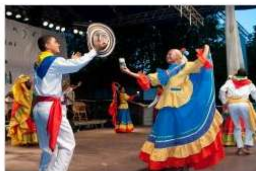
JSKD OI Črnomelj