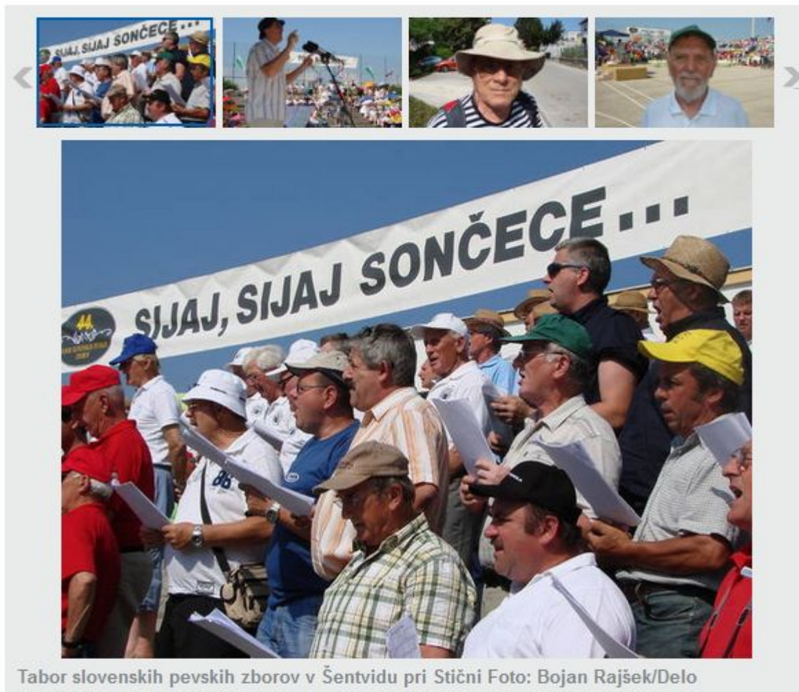
Tabor slovenskih pevskih zborov v Šentvidu pri Stični

Bojan Rajšek, Litija ned, 23.06.2013, 11:15