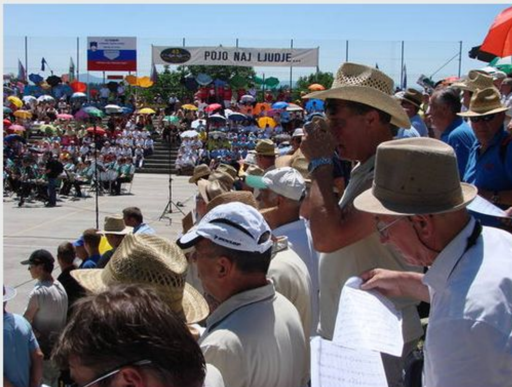
Tabor pevskih zborov

Bojan Rajšek, Litija sob, 22.06.2013, 06:00