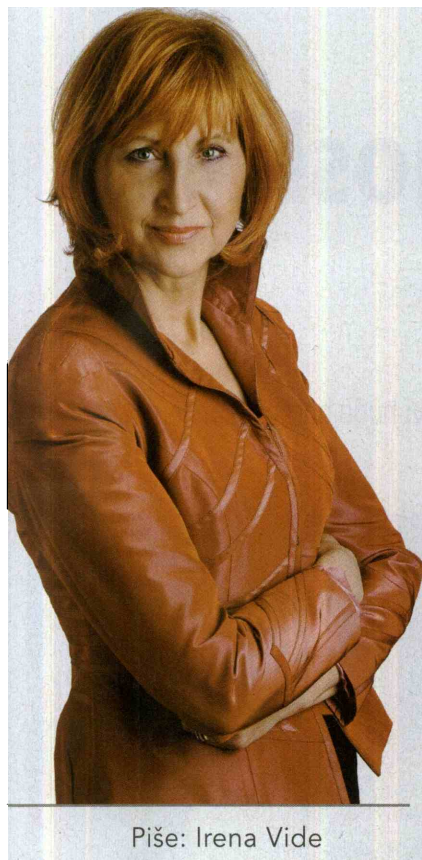
Piše: Irena Vide

Prazno je upati, da bomo legli v hrastovo senco, brž ko posadimo drevo.