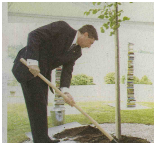
Predsednik RS Borut Pahor je posadil lipo.

Ob tej priložnosti so prireditveni prostor obogatili s knjižnimi stebri, sestavljenih iz knjig avtorjev iz Dolenjske, Bele krajine in Posavja. V Trdinovi čitalnici pa so razstavili nekaj najbolj zanimivih predmetov, ki jih hranijo v bogati zapuščini: od najstarejše knjige do najmanjše ter številne rokopise in predmete znanih Novomeščanov.