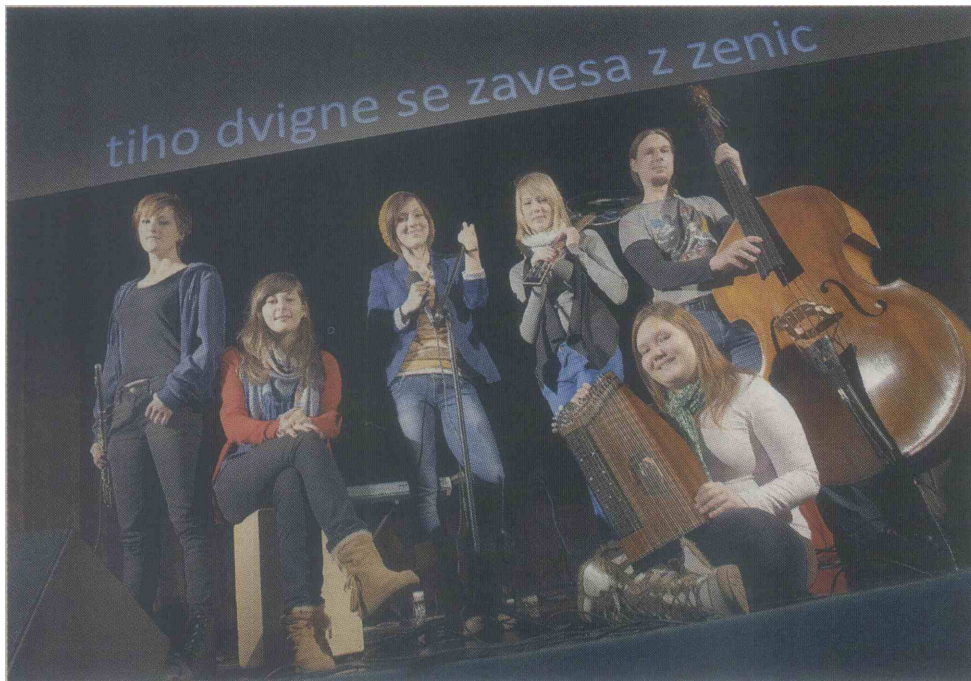
Oder naj bo priložnost za različne zvrsti: na fotografiji Matalaja iz Slovenj Gradca, rock skupina z avtorskim pristopom.