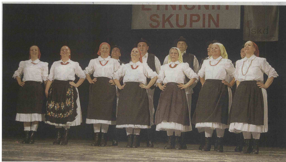
Na srečanju se je predstavila tudi folklorna skupina Hrvaškega kulturnega društva Pomurje Lendava.