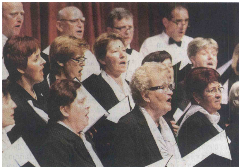
Na reviji V Sentjerneju je nastopil tudi domači Mešani pevski zbor Ajda Orehovica.