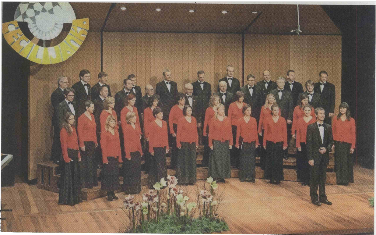
Zbor goji predvsem slovensko ljudsko in umetno pesem