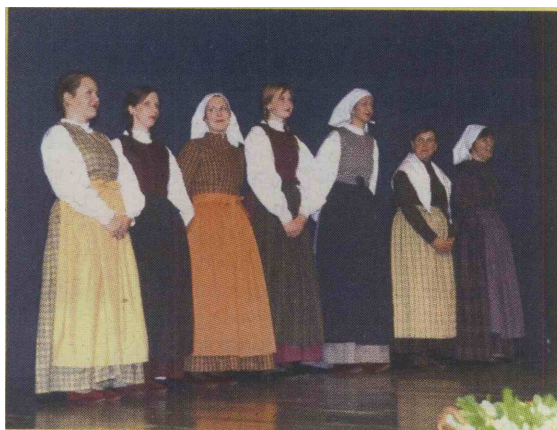
Na koncertu so se predstavile v tradicionalni podobi

Zgoščenka, ki so jo ob tej priložnosti izdale, pa vsebuje kar dva CD-ja. Na prvem so posnete ljudske ljubezenske pesmi iz Bovca in okolice zapete