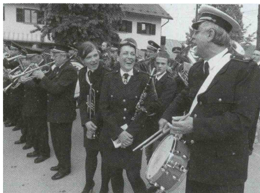
Tokrat sta največ pozornosti pritegnili brhki hrvaški godbenici