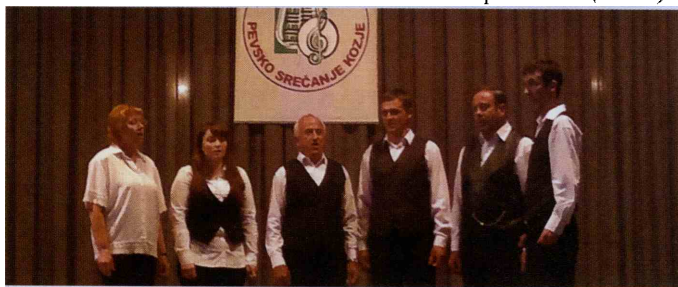
Ljudski pevci s Prevorja

“La vita” Bistrica ob Sotli, Mešani pevski zbor Dobje, Mešani pevski zbor Bistrica ob Sotli, Ljudski pevci s Prevorja, Moški pevski zbor Sromlje, Mešani pevski zbor Zarja Akvonij Šentvid pri Planini, Cerkveni mešani pevski zbor Zvon Podčetrtek in gostitelji Moški pevski zbor Kozje. Pevci so s prepevanjem raznovrstnih pesmi dokazali predanost in ljubezen do zborovskega petja, ki so jo začutili tudi številni poslušalci. (M.Re.)