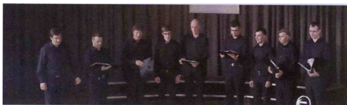
Moški pevski zbor Planina