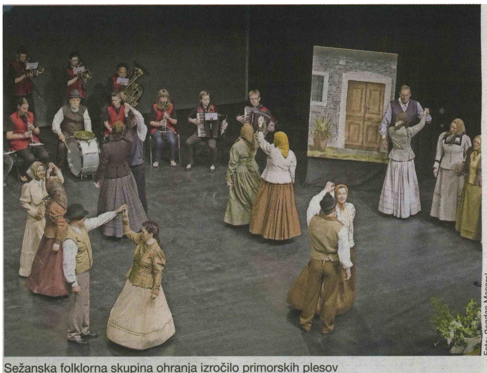
Sežanska folklorna skupina ohranja izročilo primorskih plesov