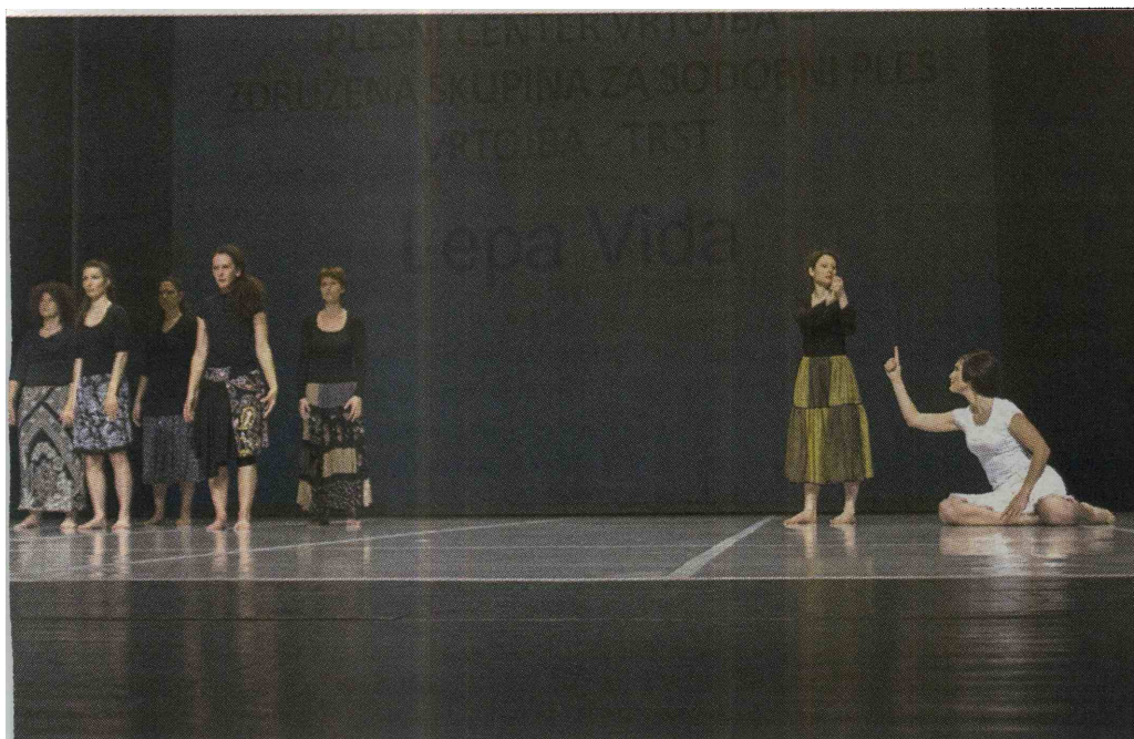
Navdušujoča presenečenja je pripravila združena plesna skupina odraslih plesalk iz Šempetra in Trsta z odlično uprizoritvijo lepe Vide