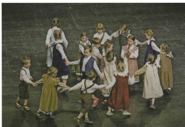
Najmlajši člani otroške folklorne skupine Kamenčki so predstavili odrsko postavitev Tamali je vse povedal