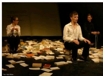
Odzivi so bili različni: nekateri so bili pretreseni, ker so se videli v vlogi sovražnika tujcev – koroški Slovenci se namreč radi smilijo samim sebi, tokrat pa so se videli tudi v zatirjevalcu.